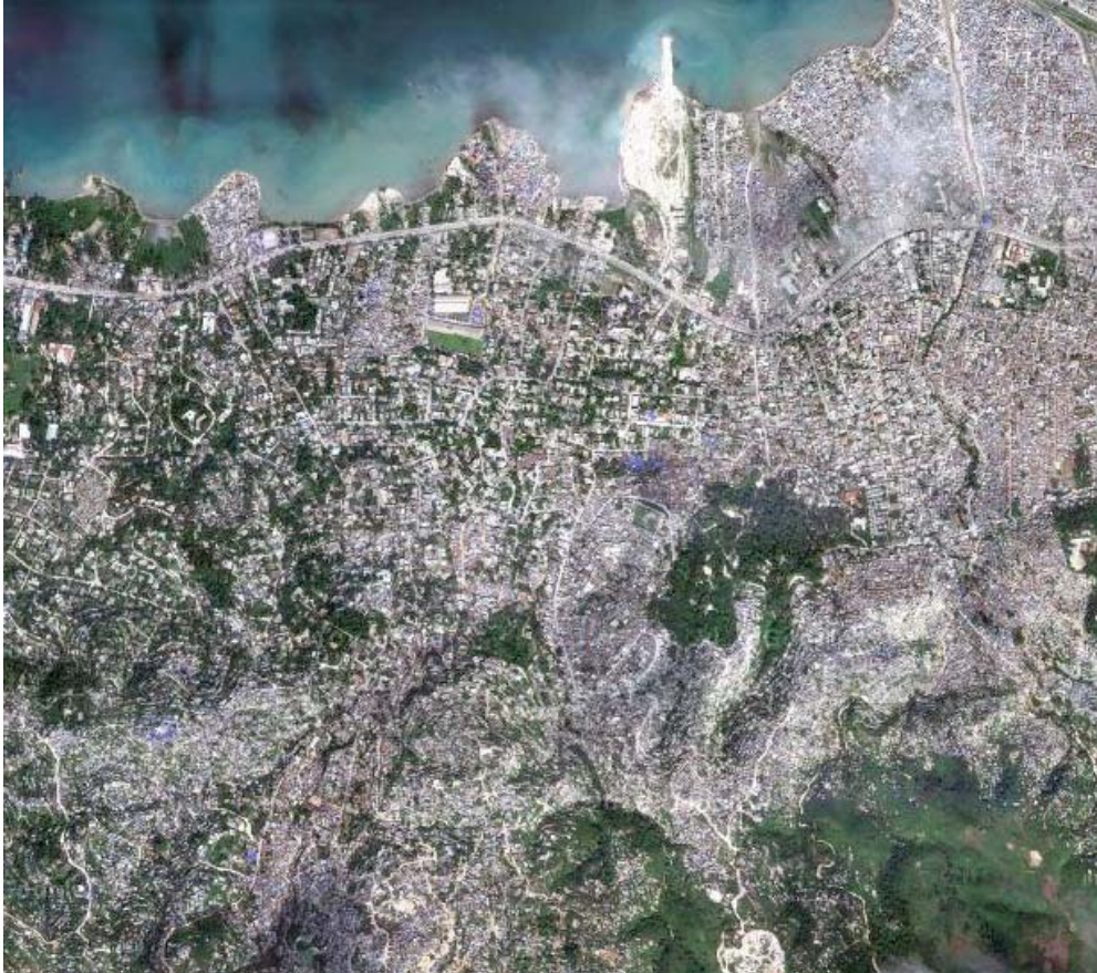
Fig. 7. Lieu d'intervention

Les étudiants travailleront par équipes (de 2, 3 ou 4 étudiants selon un plan qui sera concerté au début de la session). Chaque équipe travaillera sur une zone différente du quartier de Martissant.