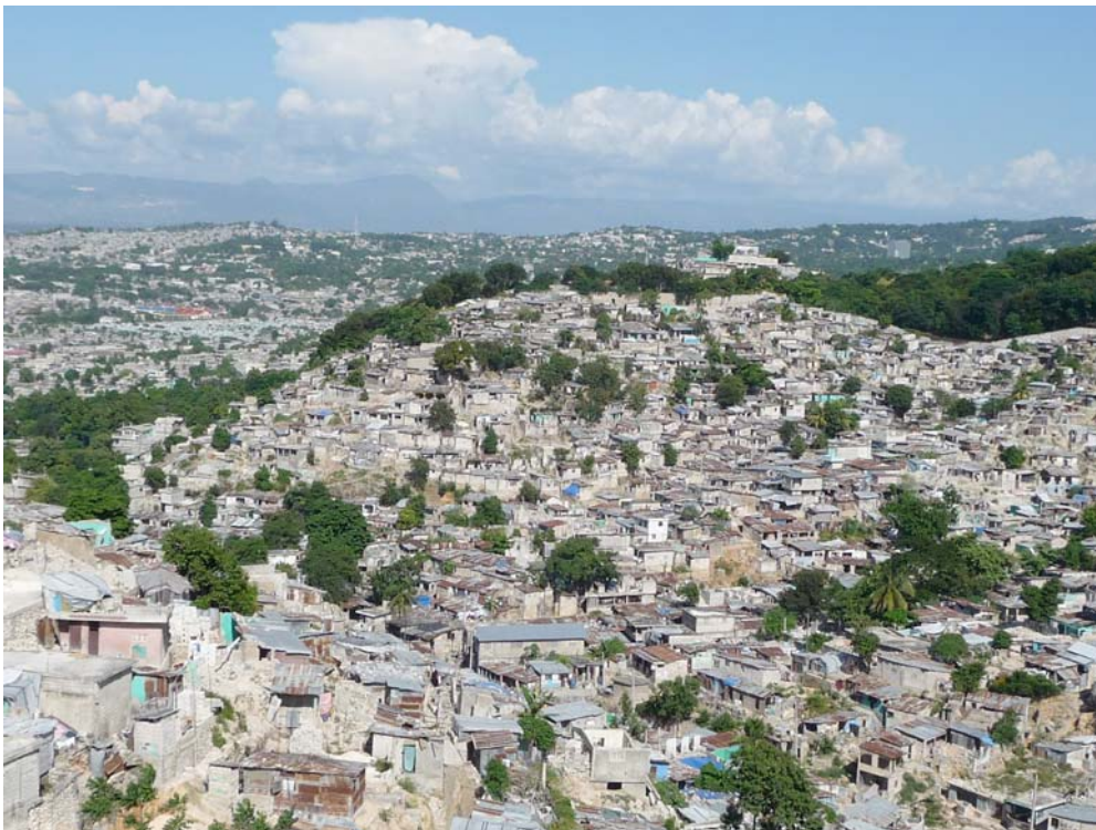
Fig. 5. Image satellite du quartier

Le quartier de Martissant se trouve au Sud-ouest de la ville de Port-au-Prince. Ce quartier, très hétérogène, inclut 4 zones importantes :