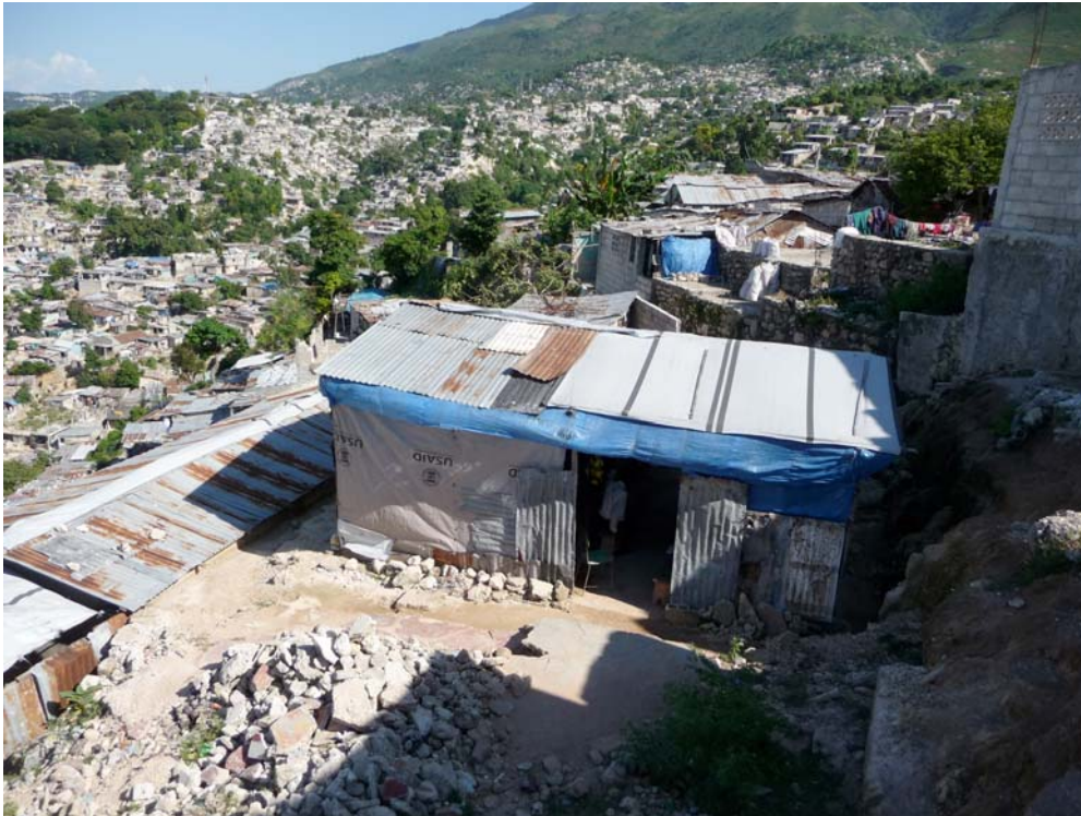
Fig. 9. Lieu d'intervention