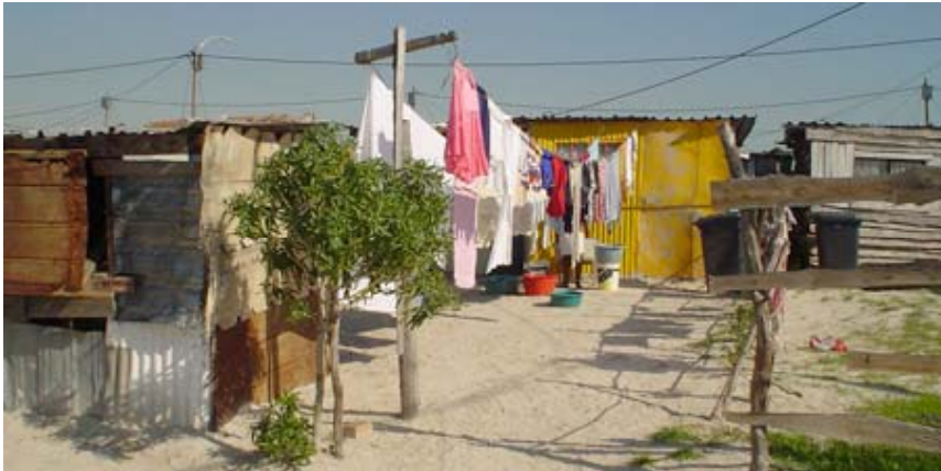
Fig 2. Afin de proposer des solutions de logement, il est important de comprendre les relations entre les aspects visibles et invisibles de l'architecture.