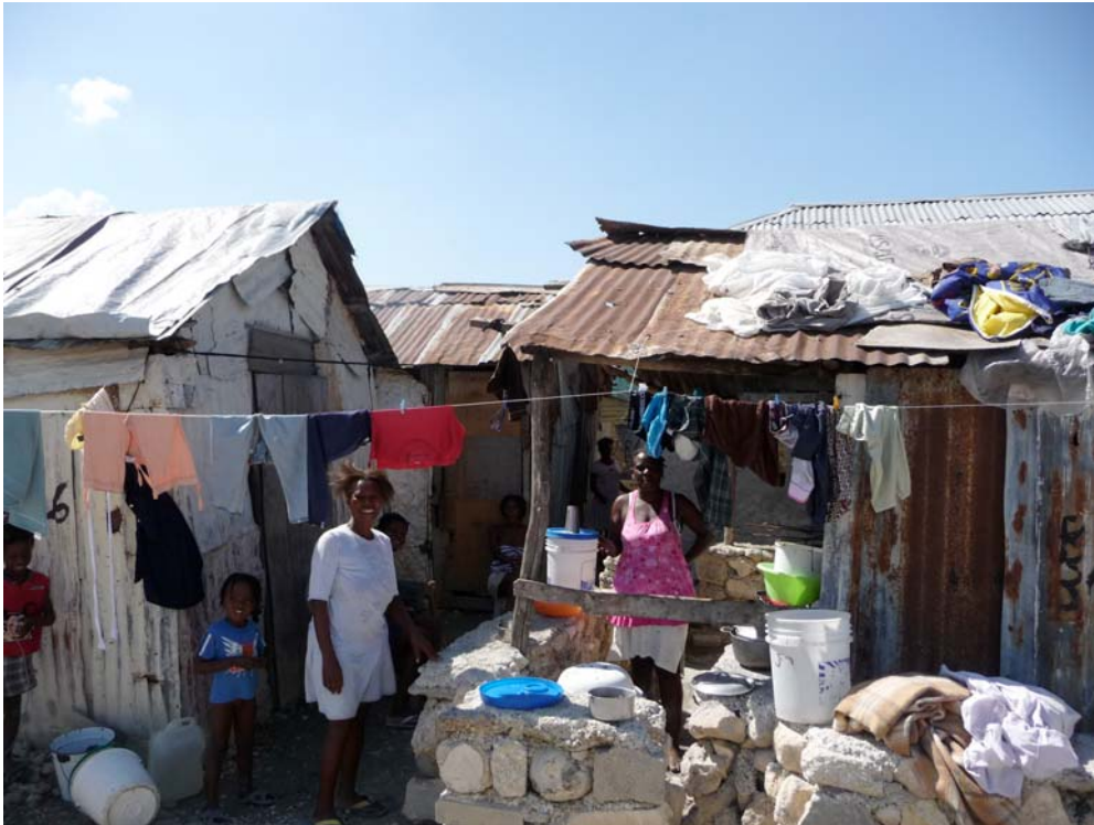
Fig. 10. Lieu d'intervention