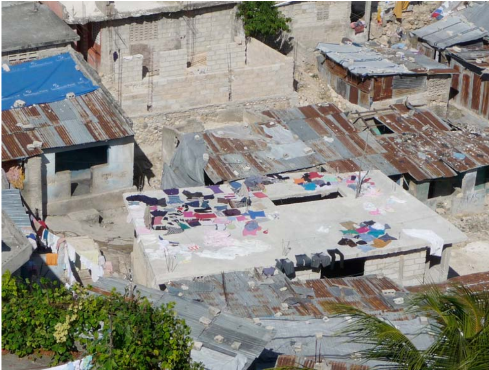
Fig. 8. Lieu d'intervention

L'œuvre architecturale (l'habitat) est considérée ici comme un catalyseur de changements sociaux et un facteur clé (et un agent) de démocratisation de la participation citoyenne.